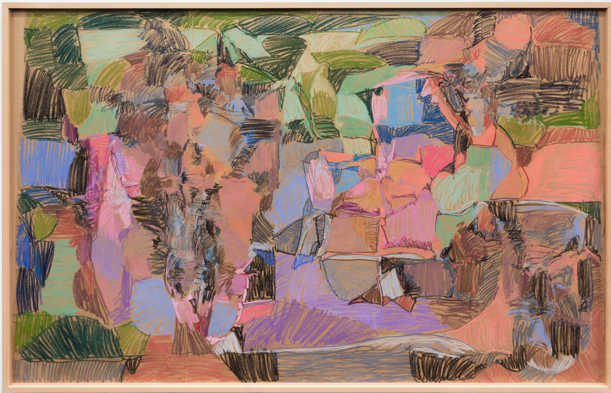
Composición. Pastela paper gainean. 168,5 x 250 cm.