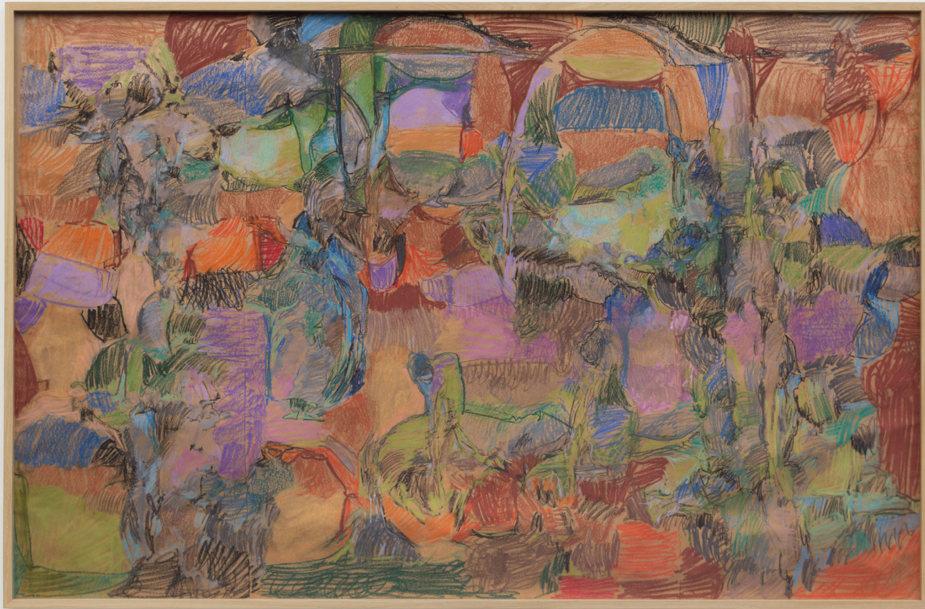
Composición. Pastela paper gainean. 168,5 x 260,5 cm.