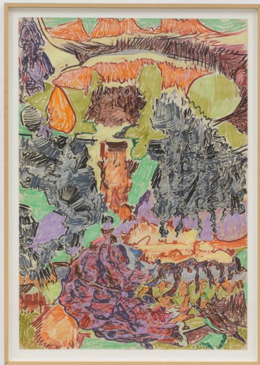
Composición. Pastela paper gainean. 161 x 110 cm.