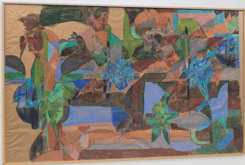
Composición Pastela paper gainean 168,5 x 278,5 cm.