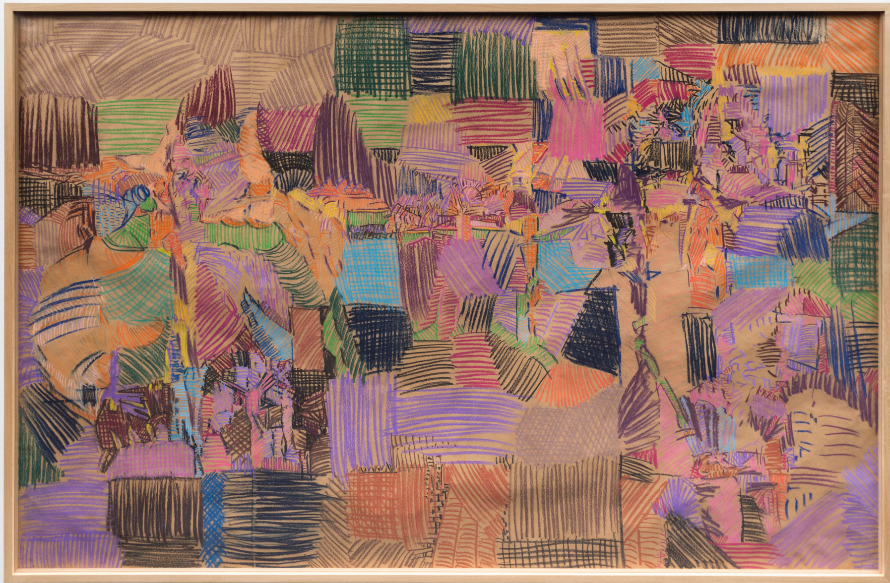
Composición. Pastela paper gainean. 168,5 x 255 cm.