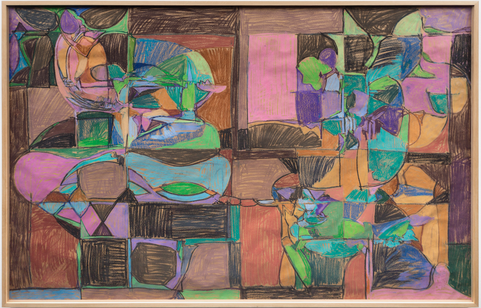
Composición. Pastela paper gainean. 168,5 x 266,5 cm.