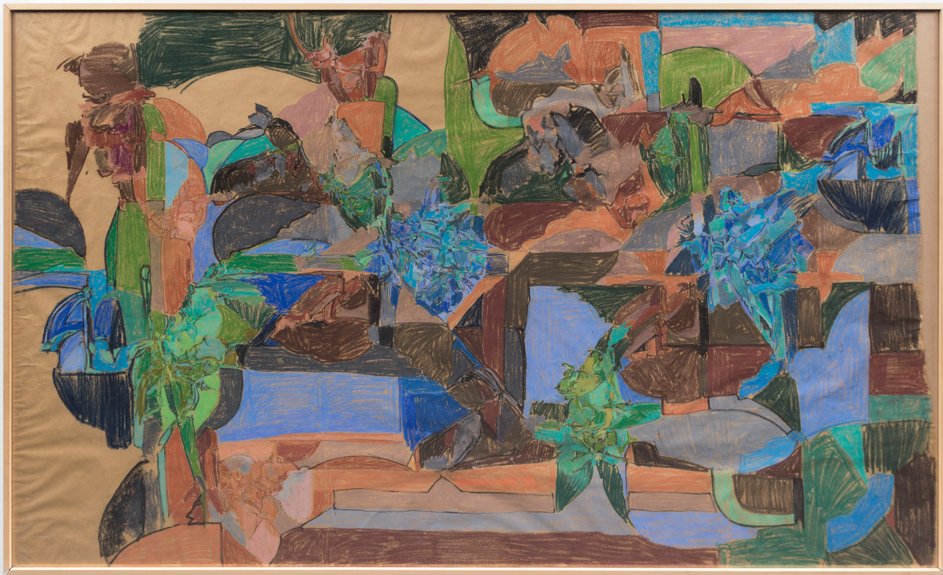
Composición. Pastela paper gainean. 168,5 x 278,5 cm.