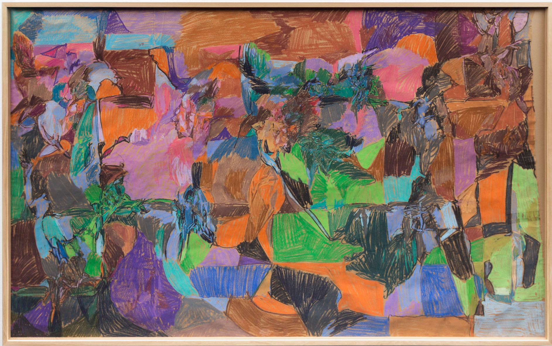
Composición. Pastela paper gainean. 168,5 x 273,5 cm.