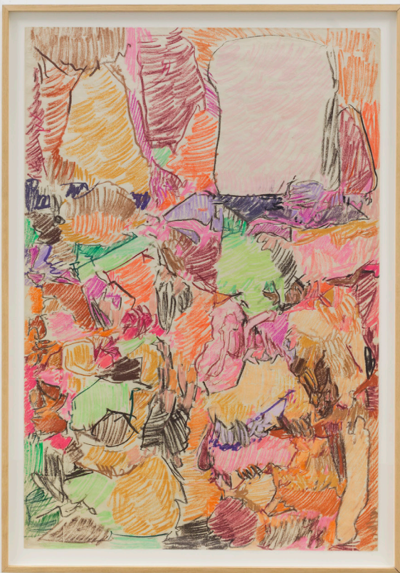
Composición. Pastela paper gainean. 161 x 110 cm.