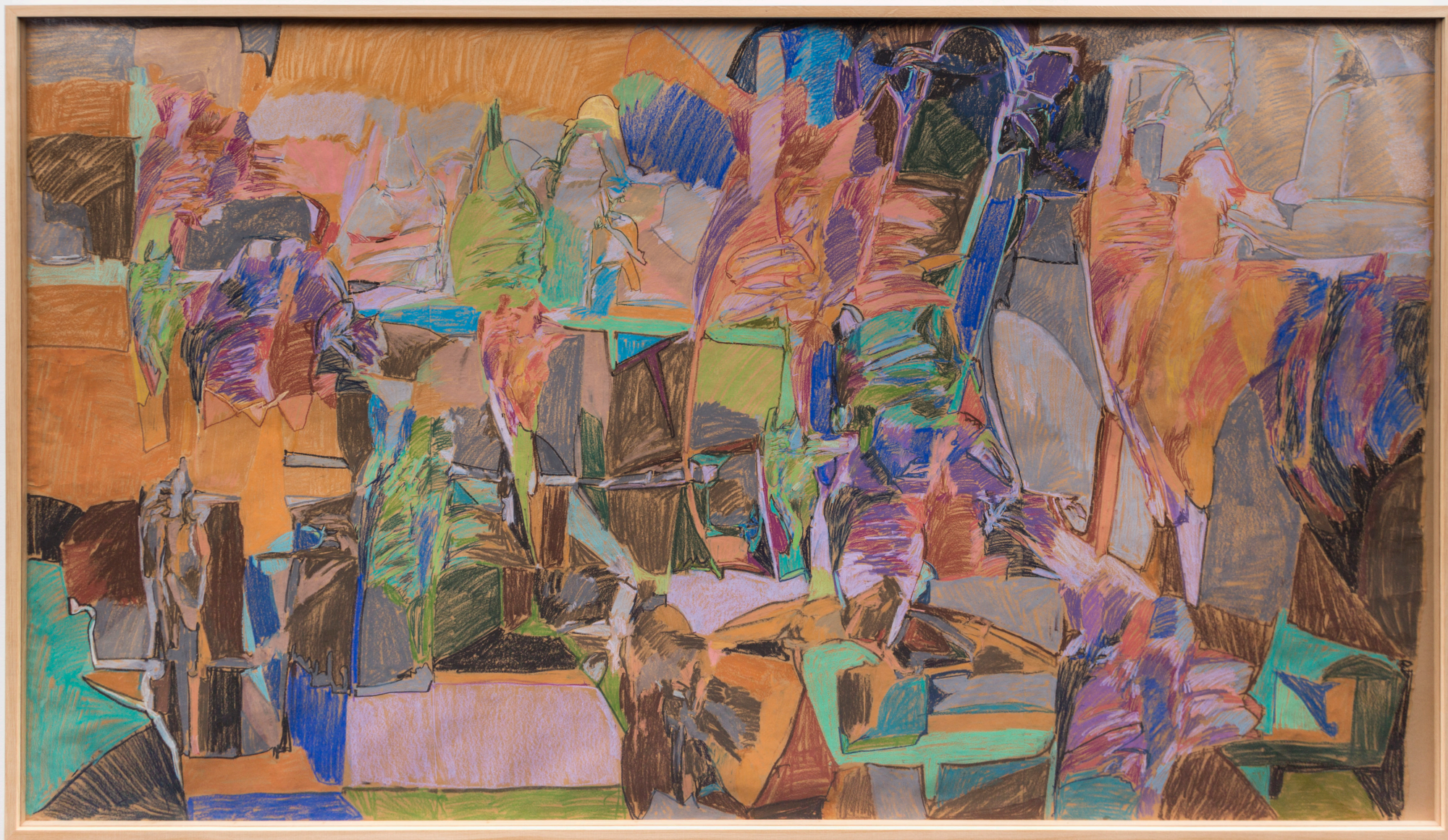
Composición. Pastela paper gainean. 168,5 x 273,5 cm.