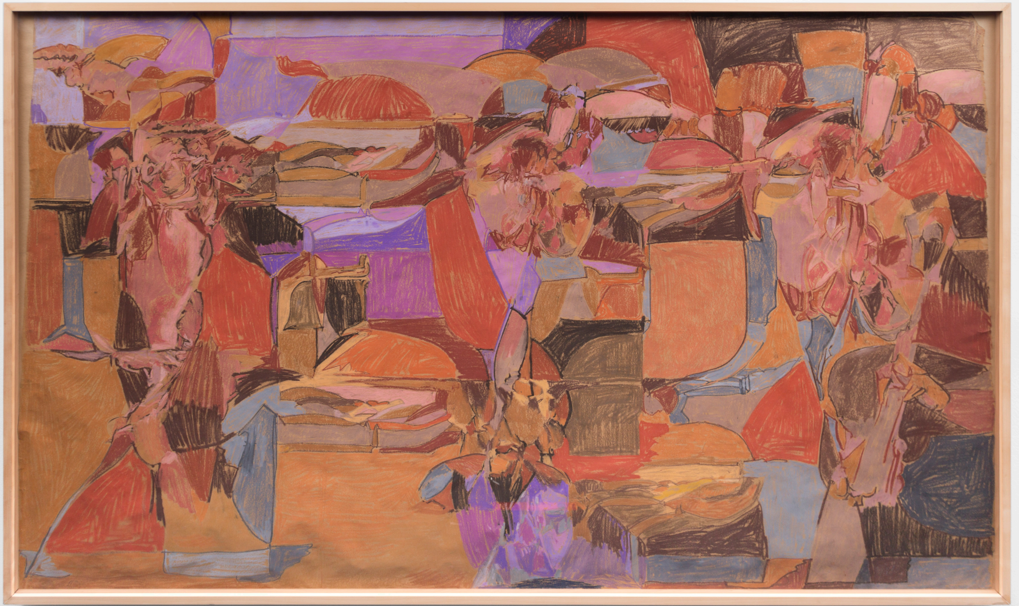
Composición. Pastela paper gainean. 168,5 x 282,5 cm.